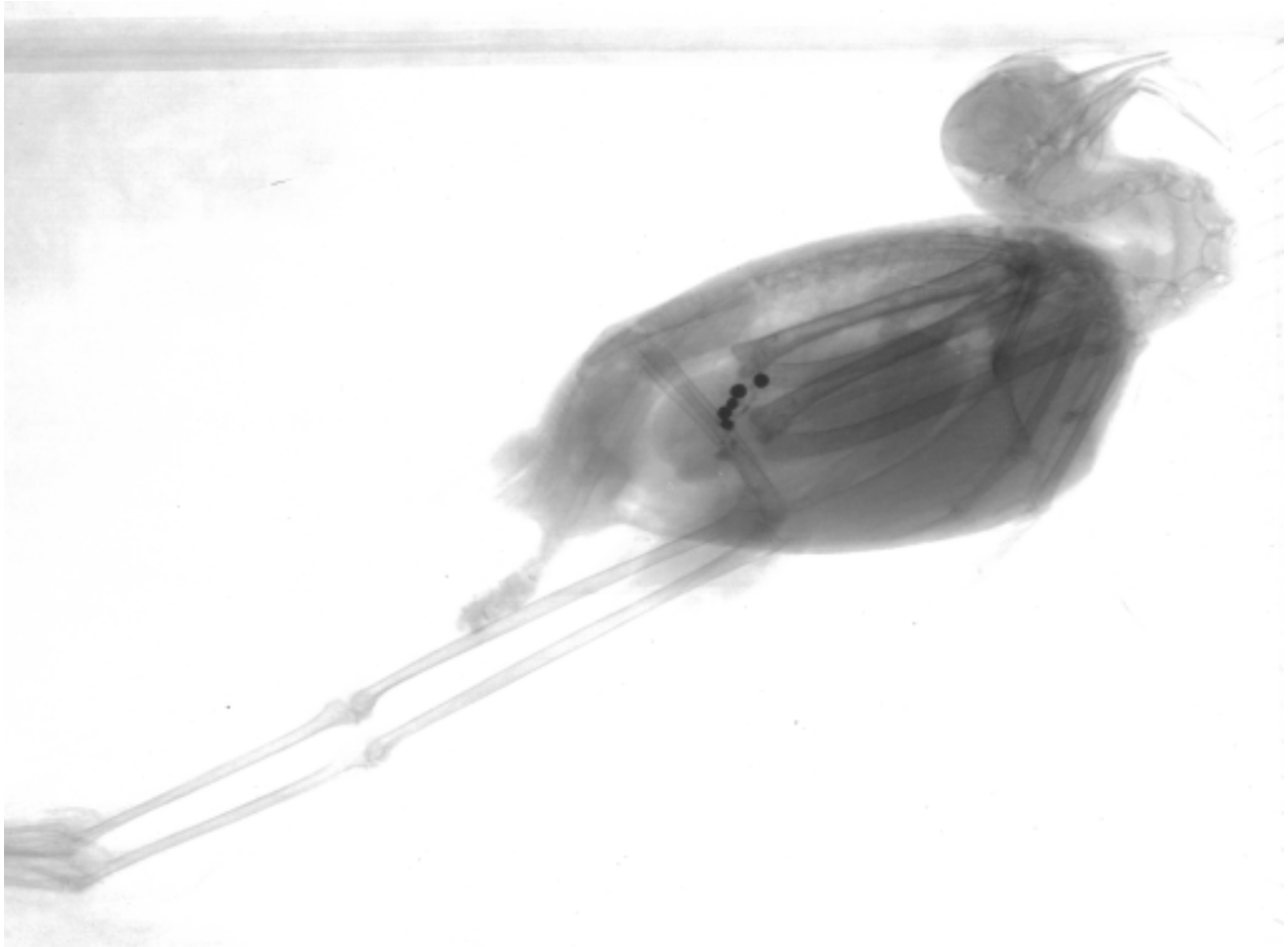
Bild 1: Tod durch Bleivergiftung: Kampfläufer mit verschluckten Bleischrotkugeln

schwunden.) Vogelliebhaber bauen dann ihre Teleskope auf, beobachten und blättern in den Bestimmungsbüchern. Die Artbestimmung gelingt nur bei guter Sicht und guter Optik. An einem Sonntag ist dann der Frieden vorbei. Bleischrot Weidgerecht und die Seinen haben lange vor Sonnenaufgang die Weiher umstellt und schießen wie besessen. Stundenlang dauert die unvorstellbare Vernichtungsschlacht. Während bei der Hasenjagd auf jedes Tier individuell gezielt wird, wird in den auffliegenden Entenschwarm ziellos hineingefeuert, offensichtlich in der Hoffnung, daß ein Bleikorn der ca. 200 Stück pro Schuß, schon irgendeine Ente irgendwie treffen werde. Ein Teil der Tiere fällt herunter und die Hunde machen sich darüber her, die meisten knicken nur ein und fliegen nicht tödlich verletzt weiter. Doch irgendwann müssen auch sie wieder aufs Wasser, da beginnt das Schrotgewitter von neuem, ein furchtbares Martyrium für die Tiere. So muß man sich den Vogelmord in Italien vorstellen. Bei