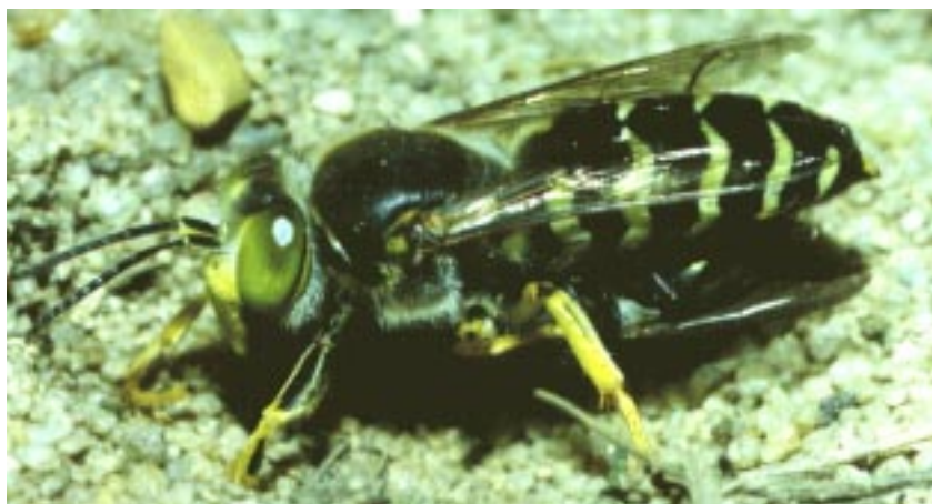
Bild 7: Die Kreiselwespe gehört zur Familie der Grabwespen, von denen ca. 200 verschiedene Arten in Bayern vorkommen. Mit einer Körperlänge von 15 bis 22 mm erreicht sie fast die Größe der allseits bekannten Hornisse. Im Gegensatz zu dieser besitzt die Kreiselwespe jedoch nur einen schwachen Giftstachel, der die menschliche Haut nicht zu durchdringen vermag. Wie alle Grabwespen legt sie für die Aufzucht ihrer Nachkommenschaft Nahrungsvorräte in Form von Insekten an. Die Kreiselwespe hat sich dabei auf den Fang von Fliegen spezialisiert. An der Riviera bestand der Speisezettel z.B. aus Schwebfliegen, Wollschwebern, Fleischfliegen, Bremsen und Schmeißfliegen.