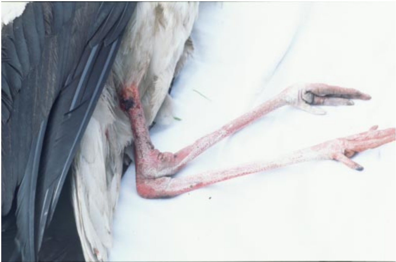
Bild 4: Gerhardshofen 1998 der offene Bruch des rechten Beines ist deutlich zu erkennen

werden, daß der Köder mit dem Narkosemittel nicht vom Brutpartner geschluckt wird und eventuell diesen, oder, durch Verfütterung an die Brut, einen Jungstorch in Narkose versetzt. Für eine erfolgreiche Narkotisierung müssen vor allen Dingen die Verhaltensgewohnheiten des verletzten Tieres wie z.B.: wo hält es sich am liebsten auf, wann fliegt es die Fütterung an, wo sind seine Ausweichstellen nach Störungen usw. bekannt sein. Nach Möglichkeit sollte der Narkoseversuch im Sinne einer erfolgreichen Behandlung so schnell wie möglich erfolgen. In der Praxis bedeutet das, daß auch das verletzte Tier die Fütterung annehmen muß, weil man ihm dort am einfachsten einen Narkoseköder unterjubeln kann. Wegen der angestrebten schnellen Wirkung des Narkosemittels, das bei wenig Mageninhalt schneller (ca. 30 Minuten) und bei vollem Magen wesentlich später (12 bis 14 Stunden) wirkt, darf sich der zu narkotisierende Storch nicht satt fressen. Er wird nach der Aufnahme des Narkosefisches sanft von der Fütterung weggedrängt. Fliegt der unverletzte Vogel vorher die