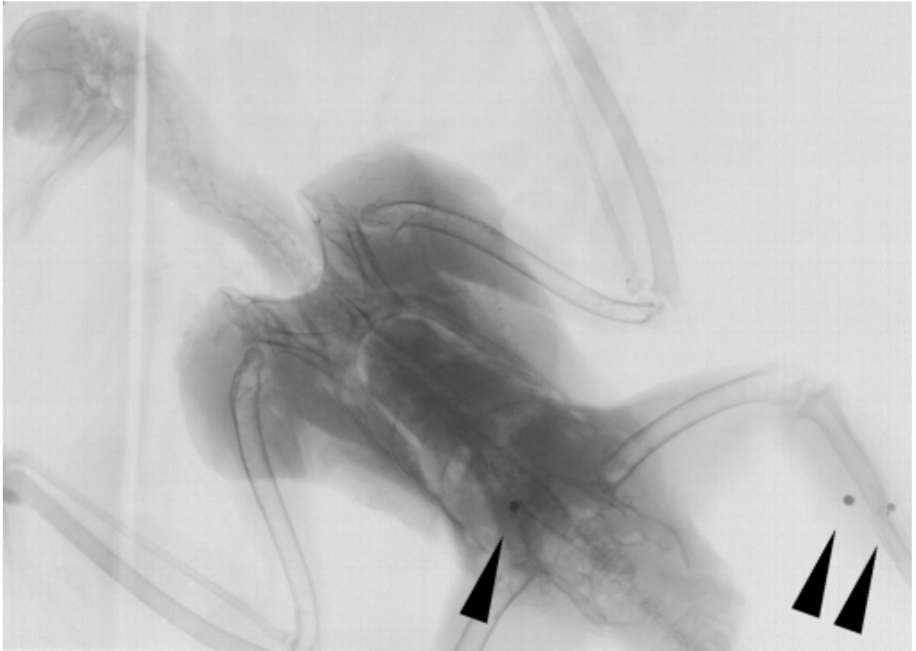
Bild 2: Habicht mit Bleischrotkugeln Ausschnitt aus Röntgenaufnahme

lang immer ein Jäger bestellt. Dies hatte zur Folge, daß die vortragene Kritik zu Selbstlob und Selbstmitleid degenerierte. Die brennenden Fragen, wie z.B. die Gesetzestreue des Bleischrot Weidgerecht oder die Mißhandlung der Carnivoren, blieben außen vor. Die traditionelle Äußerung der Behörde zur gängigen Jagdpraxis ist: "Dank für die aufopferungsvolle Tätigkeit". Wie könnte es auch anders sein, denn der Amtschef ist selbst Jäger. Die vorgelegten Röntgenbilder wurden als "ungeheuerlich" empfunden, siehe Protokoll vom 14. Mai 97, allerdings nicht das, was sie dokumentarisch belegen, sondern der Umstand, daß es einer wagte, solche Bilder mitzubringen. Erübrigt sich eigentlich zu sagen, daß wieder ein Jäger zum Jagdberater bestimmt wurde. Zur Vollständigkeit hier noch einige weitere Ereignisse von 1997: